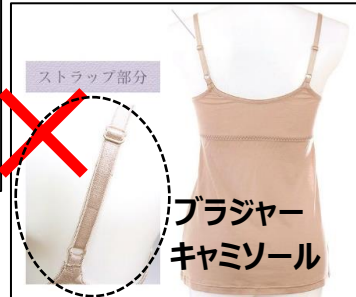
ブラジャー キャミソール