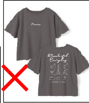
柄・ペイント・ラメの付いたシャツ