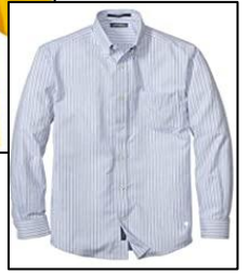
ボタンの付いたシャツ