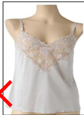
薄手の下着 (透ける素材)